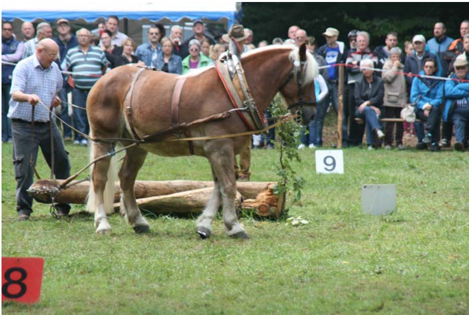
oben Metador, unten Xena